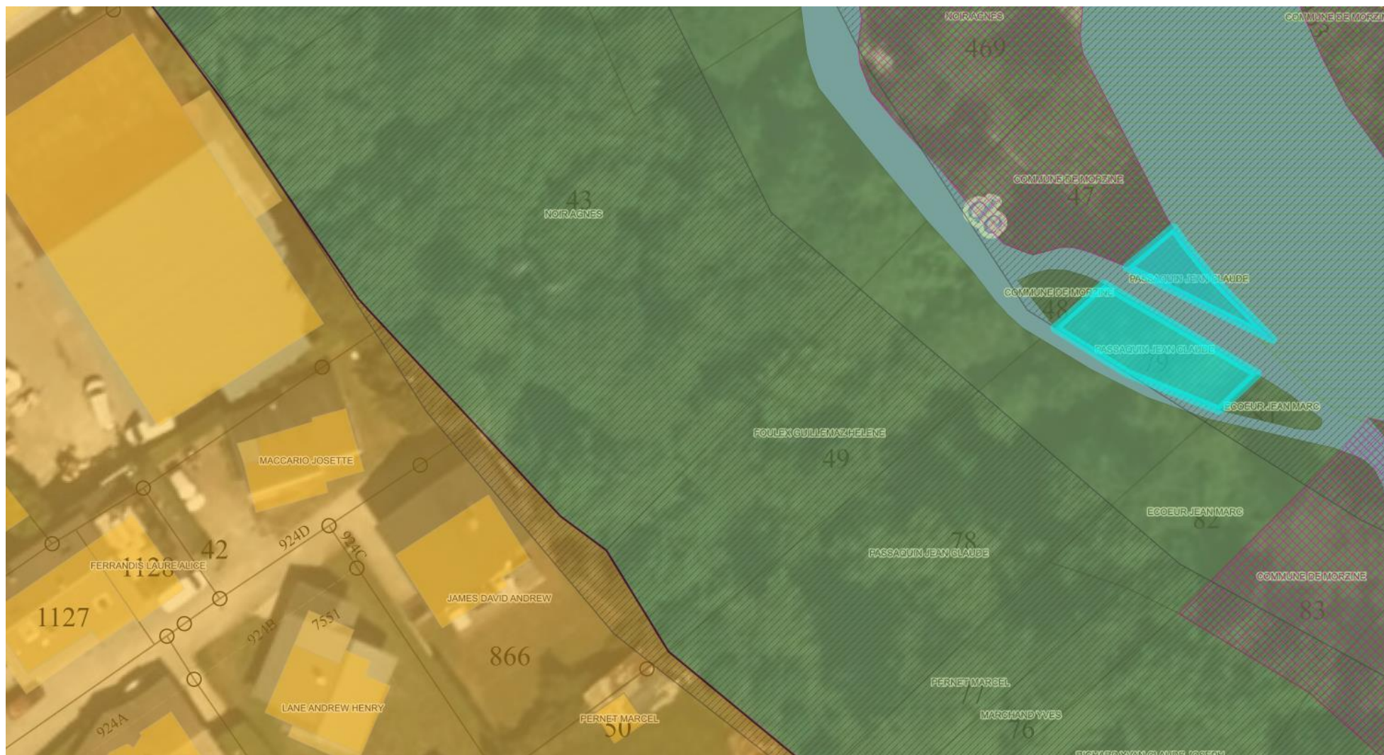
Figure 2 : superposition du zonage PLU (en rose l'ER 240 sur la parcelle AE 80)